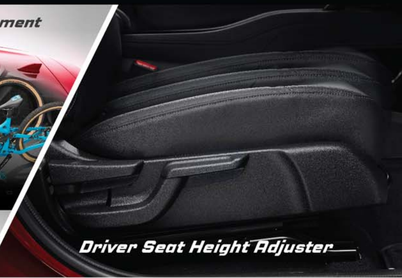
Driver Seat Height Adjuster