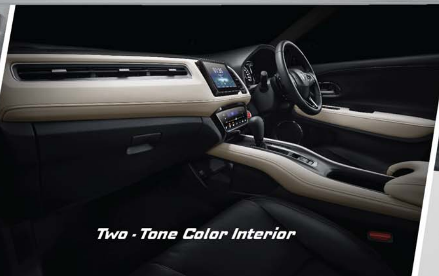
Two - Tone Color Interior