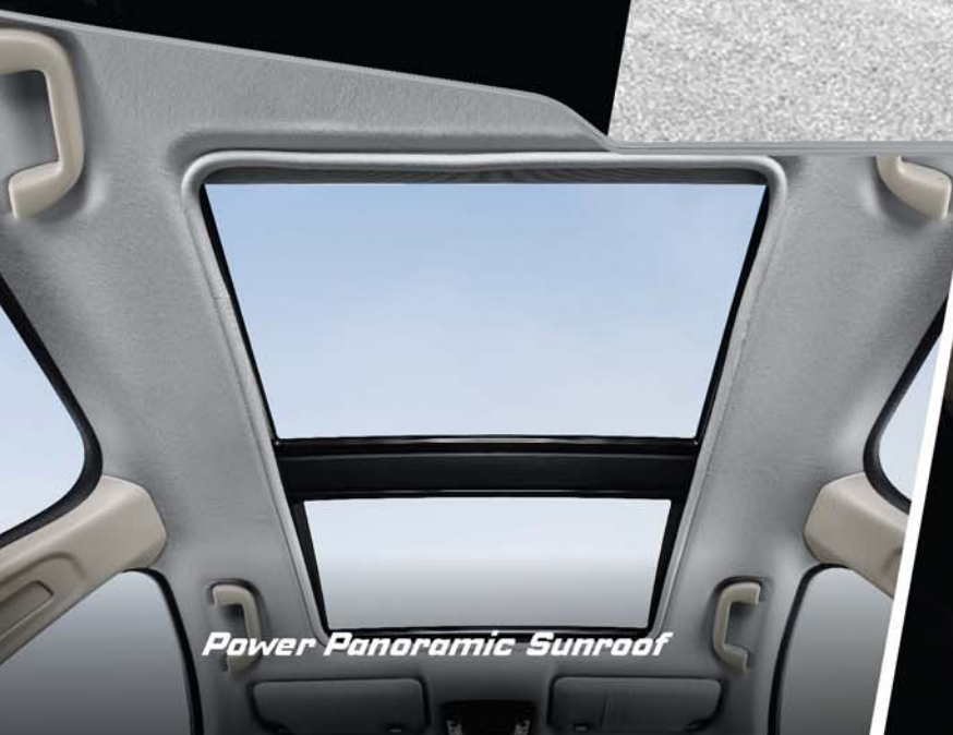
Power Panoramic Sunroof