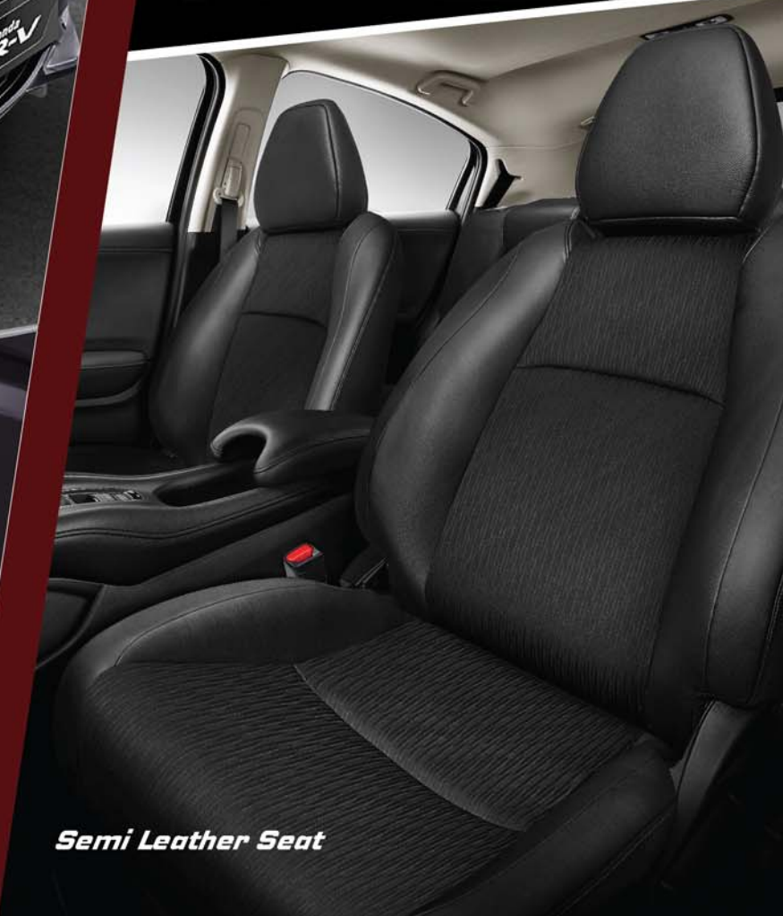
Semi Leather Seat