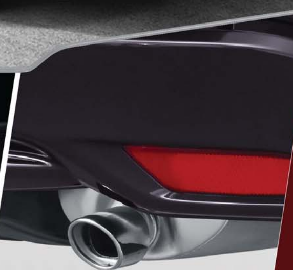
Chrome Exhaust Pipe Finisher