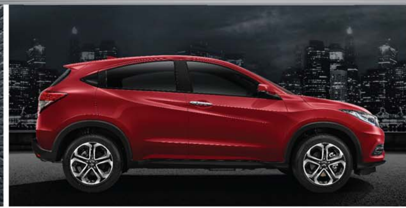
MacPherson Strut & H-Shape Torsion Beam Suspension