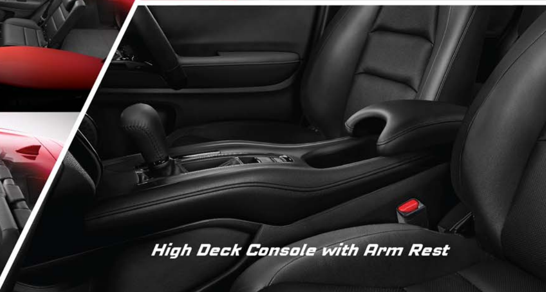
High Deck Console with Arm Rest