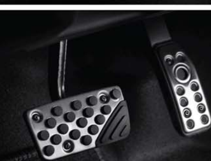
NEW Sporty Pedal Pad