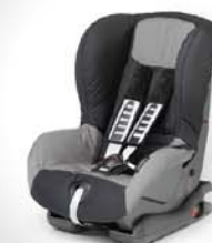
ISOFIX Child Seat