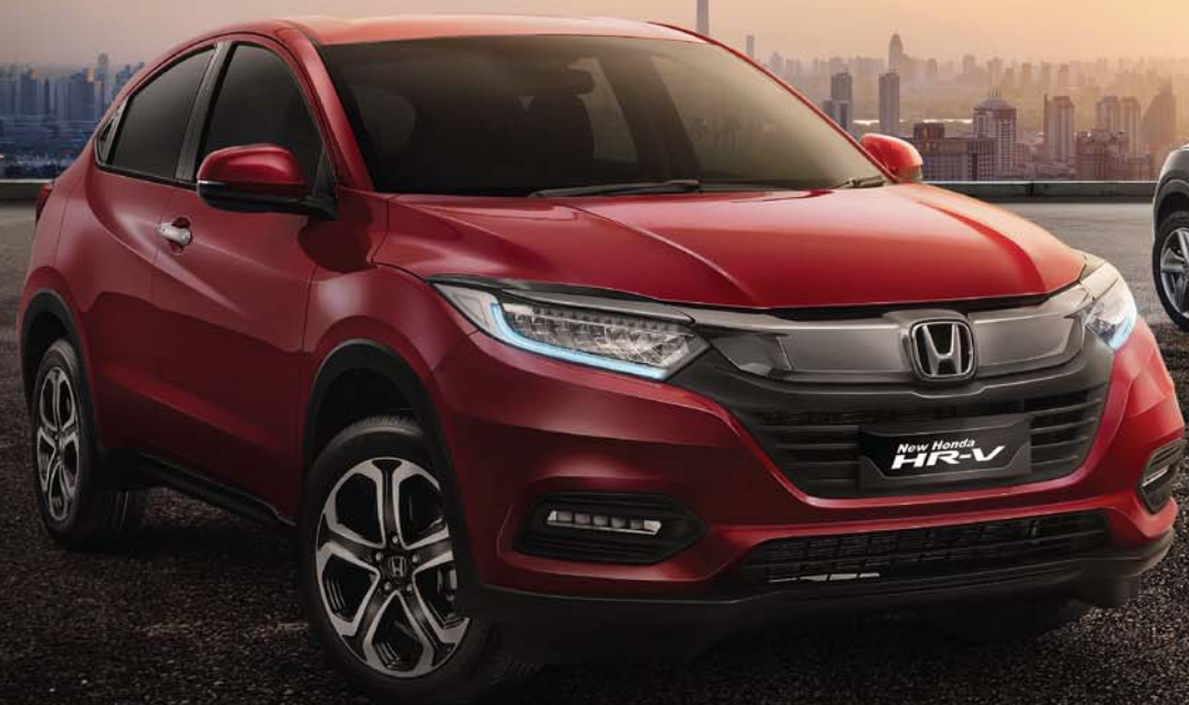
1.5L E Special Edition