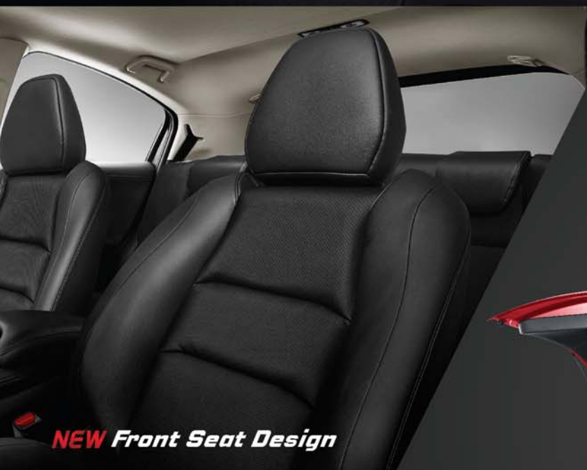
NEW Front Seat Design

Berpetualang dengan penuh kenyamanan sepanjang perjalanan dalam ruang kabin New Honda HR-V yang fleksibel dan luas.