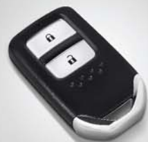
Smart Key (Tipe 1.5L E & 1.8L Prestige)