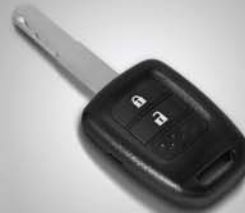
Wave Key + Keyless Entry (Tipe 1.5L S)