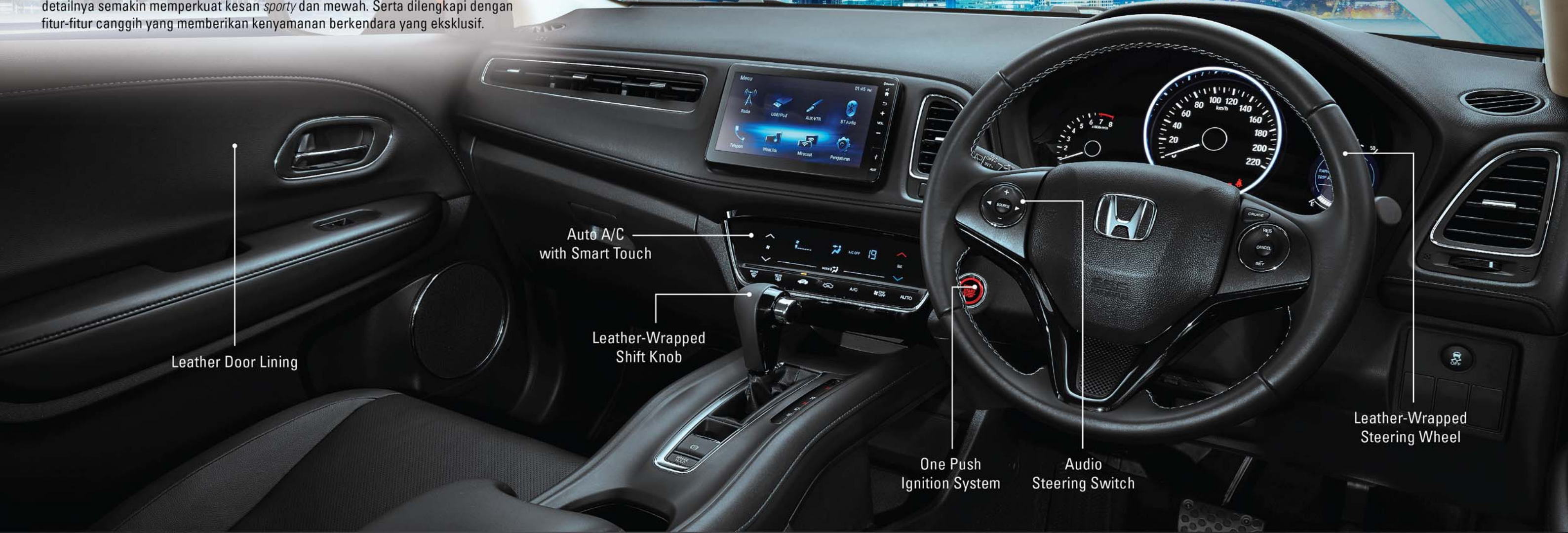
Leather Door Lining

Interior New Honda HR-V yang dibalut dengan kombinasi material kulit di setiap detailnya semakin memperkuat kesan sporty dan mewah. Serta dilengkapi dengan fitur-fitur canggih yang memberikan kenyamanan berkendara yang eksklusif.